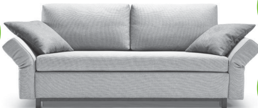
Aktion ohne Zierkissen

NEU: Softausführung in Sitz und Rücken gegen Aufpreis