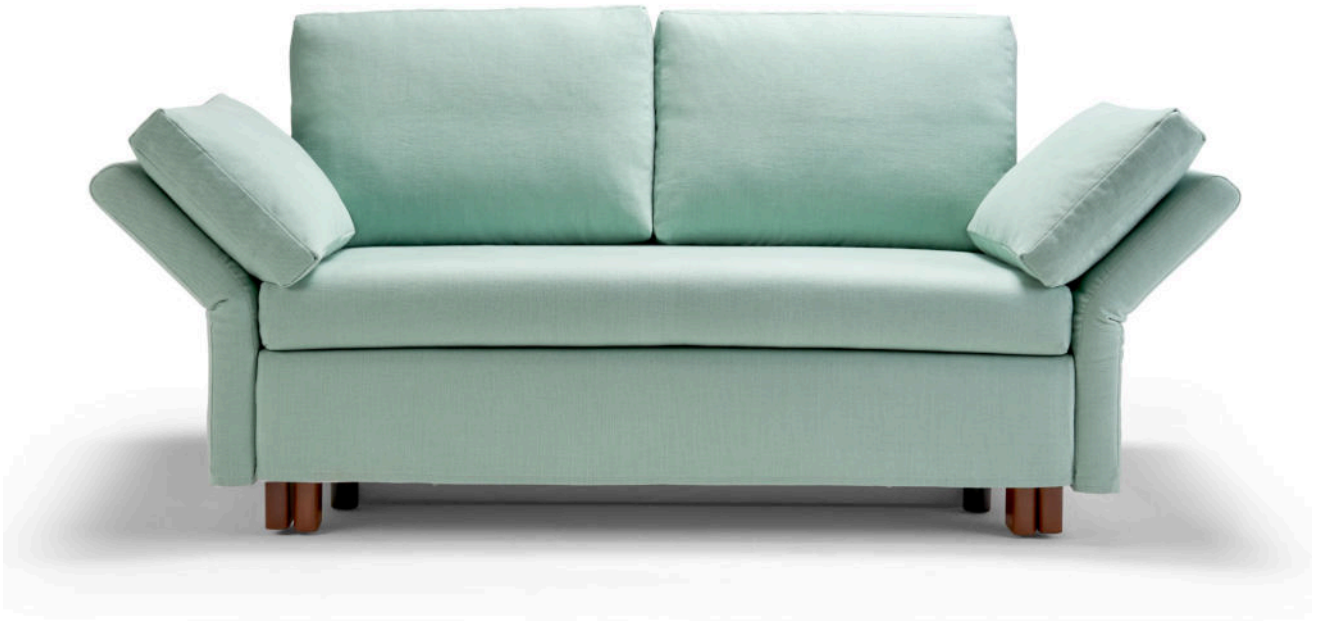
Paula Schlafsofa 136, Breite ca. 152 cm, mit abgeklappten Seitenteilen ca. 200 cm, Füße aus Buchenholz