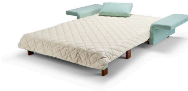
Abb. mit Baumwollauflage, Liegefläche ca. 133 x 209 cm