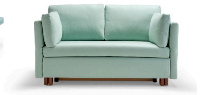
Schlafsofa 136, Seitenteile nicht abgeklappt